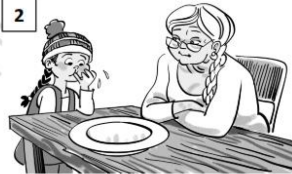
Wait for your child to share