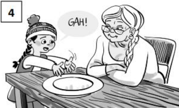
Wait for your child to share in return