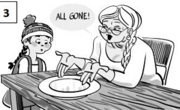
If your child doesn't share, Show and Say