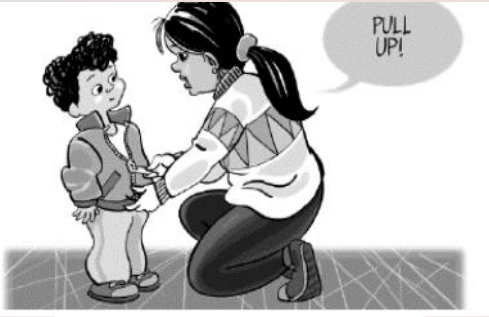
LEVEL 1: Show and Say