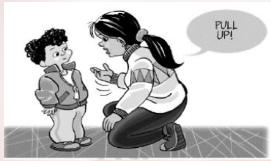
LEVEL 2: Say again