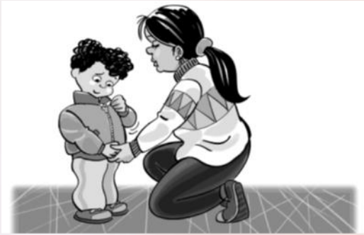
LEVEL 3: Give a little physical help to start or finish the action.