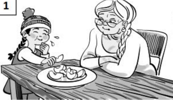
During an everyday activity...