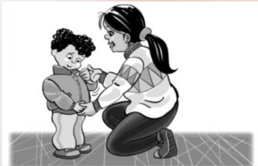
LEVEL 4: Give a lot of physical help by gently taking the child's hand and doing the whole action from start to finish.